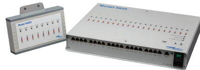
Model 5820 Ionizer Monitoring System